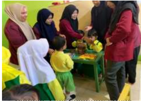
Gambar 1. Mendampingi Anak

Tim pengabdian dan guru melakukan pengamatan langsung terhadap perilaku afektif anak, mencatat perubahan yang terjadi, serta mendokumentasikan proses kegiatan. Guru dan tim pengabdian mengamati sikap sosial anak seperti sopan, bergiliran, bekerja sama dan jujur.