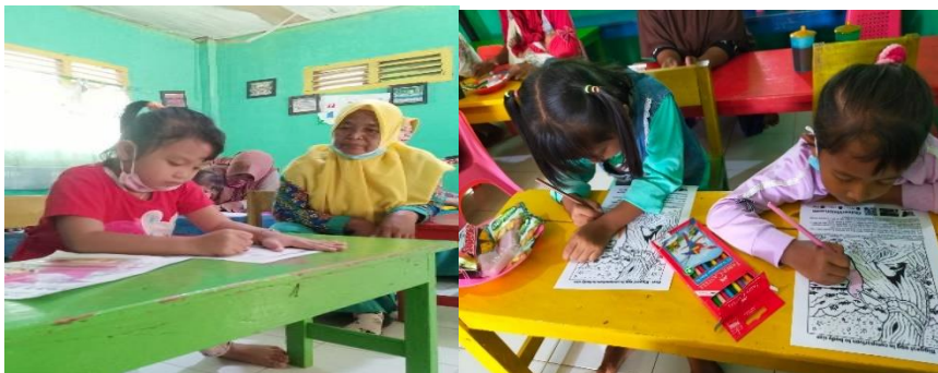
Gambar 2. Simulasi penggunaan augmented reality pada anak

Sesi ketiga dalam pelaksanaan pelatihan ialah simulasi. Guru-guru mencoba mengintegrasikan AR ke dalam rencana pembelajaran sehari-hari. Peserta pelatihan yaitu Guru PAUD dan Sekolah Dasar diminta untuk mempraktikkan penggunaan AR pada anak. Guru menggunakan aplikasi AR untuk penyampaian materi seperti pengenalan hewan-hewan kepada anak-anak dengan menampilkan animasi 3D yang hidup. Skenario pembelajaran ini disesuaikan dengan kurikulum PAUD dan Sekolah Dasar, juga kebutuhan anak-anak, seperti permainan edukatif atau kegiatan bercerita berbasis AR.