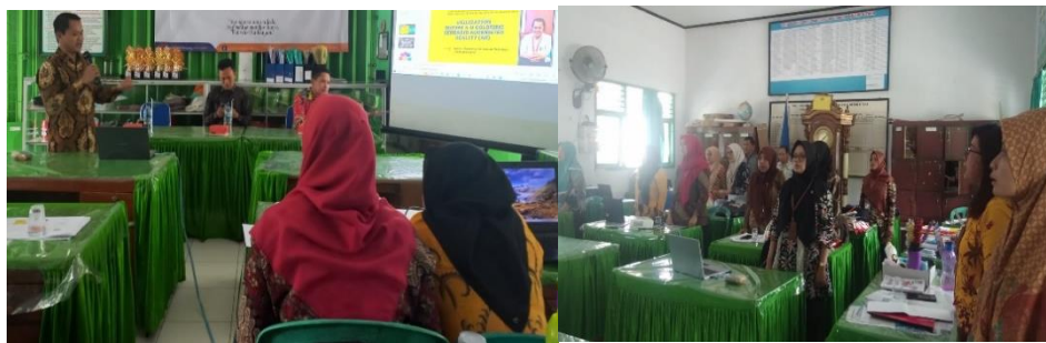
Gambar 1. Pemberian materi pada peserta pengabdian

Pelaksanaan pelatihan: Pelatihan dilaksanakan dalam beberapa sesi, meliputi sesi teori yang berupa pemberian materi pelatihan, sesi praktik, dan sesi simulasi. Sesi teori berupa pemberian materi pengenalan konsep teknologi AR dan potensinya dalam meningkatkan interaksi pembelajaran. Dalam pemaparan materi ini, tim pengabdian menjelaskan bagaimana AR dapat digunakan untuk membuat pembelajaran lebih konkret dan mudah dipahami oleh anak-anak, terutama dalam memvisualisasikan konsep abstrak. Tim pengabdian memberikan contoh-contoh penggunaan AR dalam kegiatan pembelajaran sehari-hari, yang dirancang untuk pembelajaran anak. Contoh materi disesuaikan dengan kebutuhan kurikulum PAUD dan Sekolah Dasar sehingga guru dapat melihat relevansi langsung teknologi AR dengan rencana pembelajaran mereka. Tahap ini diakhiri dengan sesi tanya jawab, di mana guru dapat berdiskusi untuk memperjelas pemahaman mereka dan mengidentifikasi potensi penerapan AR dalam konteks kelas masing-masing.