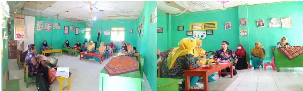
Gambar 2. Praktik penggunaan augmented reality

Sesi ketiga dalam pelaksanaan pelatihan ialah simulasi. Guru-guru mencoba mengintegrasikan AR ke dalam rencana pembelajaran sehari-hari. Peserta pelatihan yaitu Guru PAUD dan Sekolah Dasar diminta untuk mempraktikkan penggunaan AR pada anak. Guru menggunakan aplikasi AR untuk penyampaian materi seperti pengenalan hewan-hewan kepada anak-anak dengan menampilkan animasi 3D yang hidup. Skenario pembelajaran ini disesuaikan dengan kurikulum PAUD dan Sekolah Dasar, juga kebutuhan anak-anak, seperti permainan edukatif atau kegiatan bercerita berbasis AR.