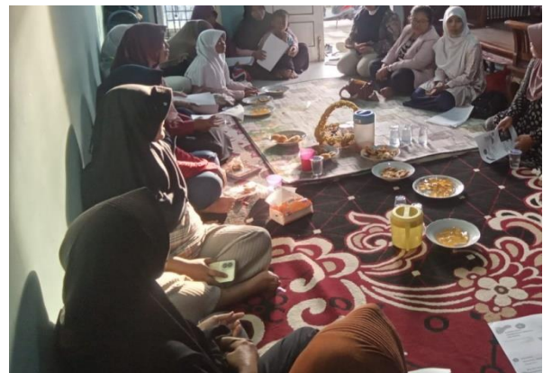
Gambar 2. Peserta PKM Fokus Menyimak Materi PKM