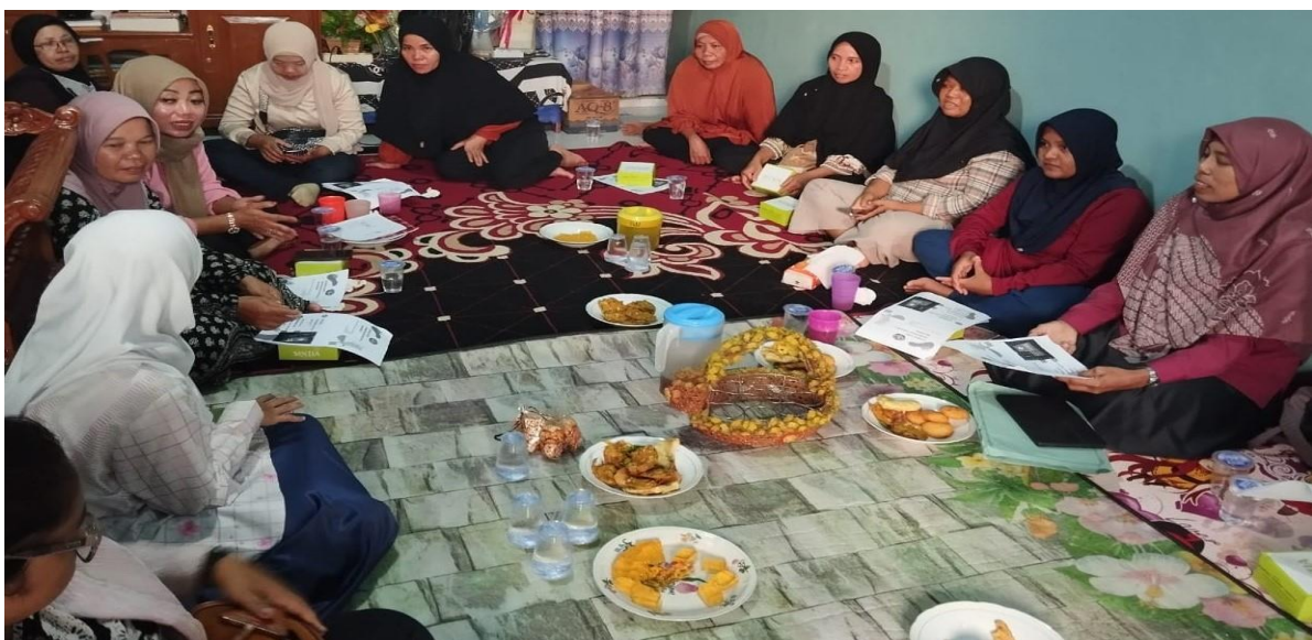
Gambar Gambar 3. Salah satu peserta PKM mengajukan pertanyaan kepada tim PKM pada sesi diskusi

Pada sesi diskusi seperti gambar 3, ibu-ibu KPM PKH mengungkapkan akan meningkatkan identitas yang kuat guna mencapai kualitas hidup yang lebih baik. Selanjutnya, juga akan memegang teguh beberapa prinsip yang berfokus pada peningkatan kualitas hidup keluarga dan pemanfaatan bantuan yang diberikan untuk kesejahteraan jangka panjang. Tim PKM STIE Jambi menyampaikan bahwa ibu-ibu penerima KPM PKH perlu mengenali potensi dan keterampilan diri guna membentuk keunikan yang merupakan elemen kunci dalam membangun personal branding . Artinya peserta PKM masih butuh pendampingan secara maksimal dalam bentuk pelatihan terutama bagi ibu-ibu yang memiliki usaha. Kompetensi personal dalam program keluarga harapan sangat dibutuhkan, sebagai penguat bagi ibu-ibu penerima KPM PKH dapat keluar dari kemiskinan serta tidak lagi bergantung terhadap bantuan PKH. Apalagi personal branding ini dapat membuka peluang untuk mendapatkan lebih banyak dukungan sosial, ekonomi, dan kesempatan yang lebih baik.