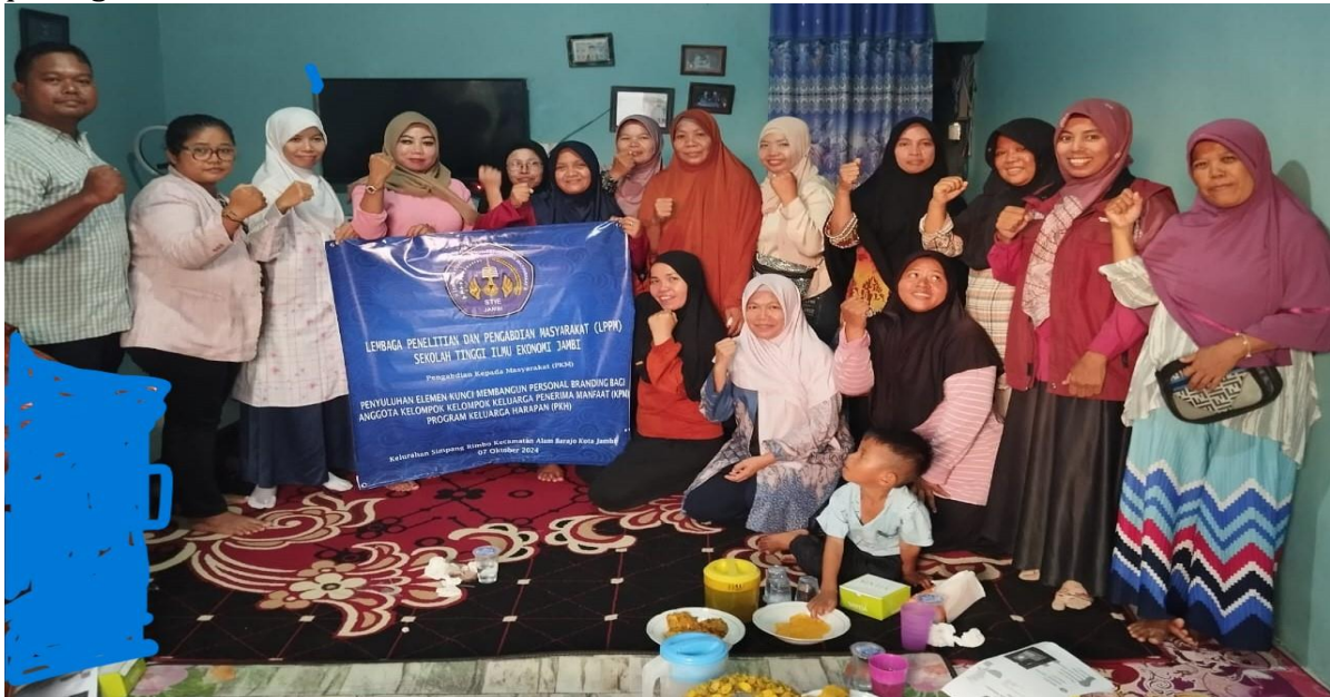
Gambar 4. Foto bersama antara peserta dengan tim PKM

Kegiatan pengabdian ini secara umum berjalan dengan lancar. Pendamping PKH turut memfasilitasi mempersiapkan tempat pelaksanaan pengabdian kepada masyarakat. Adapun output yang didapat dari kegiatan pengabdian kepada masyarakat ini diantaranya sasaran pengabdian mendapatkan pengetahuan dan memahami mengenai isi materi. Kegiatan pengabdian diakhiri dengan foto bersama seperti terlihat pada gambar 4