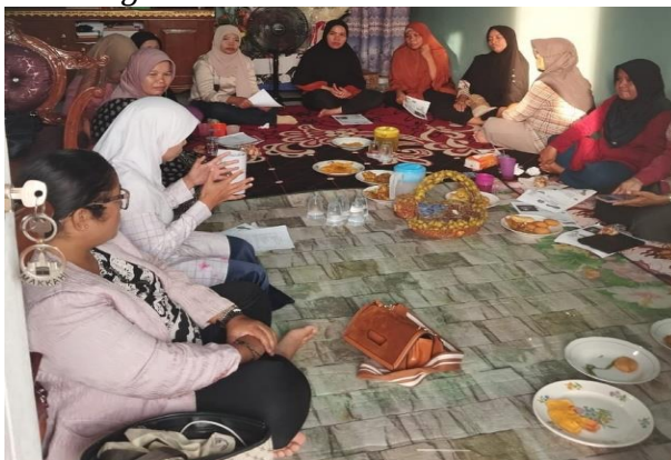
Gambar 1. Penyampaian Materi Oleh Tim PKM STIE Jambi

Pada sesi pemaparan materi tersebut, ibu-ibu anggota KPM PKH dapat mengikuti kegiatan dengan baik. Kondisi ini terlihat pada gambar 1 dan 2. Pada saat pemaparan materi, terungkap sebagian ada yang pernah mendengar tentang personal branding dan sebagian lainnya belum mengetahui tentang personal branding dan cara membangun personal branding . Maka dari itu, perlu peningkatan pengetahuan tentang personal branding .