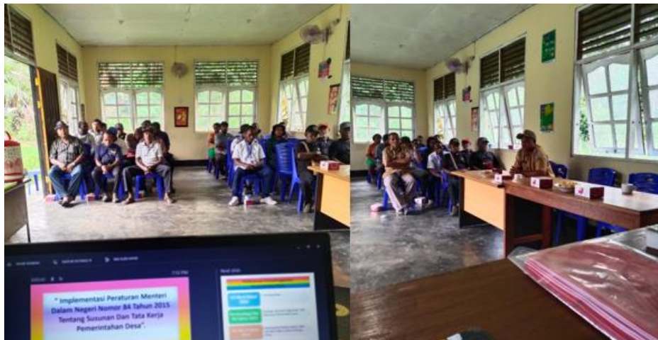
Gambar 4. Peserta Kegiatan Sosialisasi Kegiatan ini turut diikuti oleh Kepala Kampung (desa)

Kegiatan ini diikuti dengan baik oleh Kepala Kampung dan aparaturnya Pemerintahan Kampung Sereh (gambar 4). Setelah selesai penyampaian materi sosialisasi oleh pemateri kedua, dilanjutkan dengan sesi tanya jawab oleh peserta terkait dengan pelaksanaan tugas, fungsi dan kedudukan dari aparat kampung.